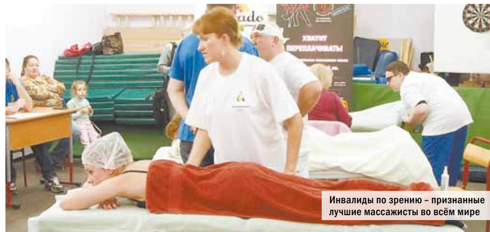
Инвалиды по зрению — признанные лучшие массажисты во всём мире