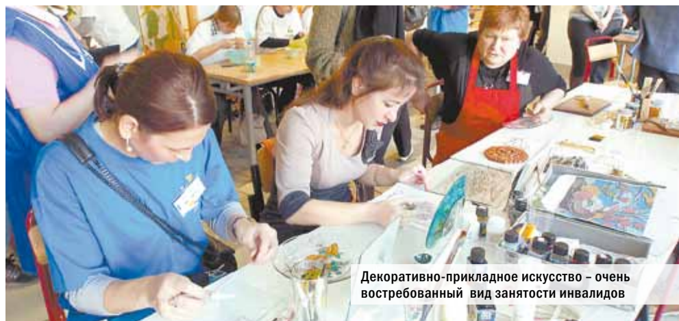
Декоративно-прикладное искусство — очень востребованный вид занятости инвалидов